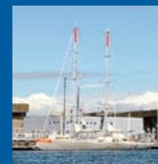
Lorient, le port d'attache de "Tara"