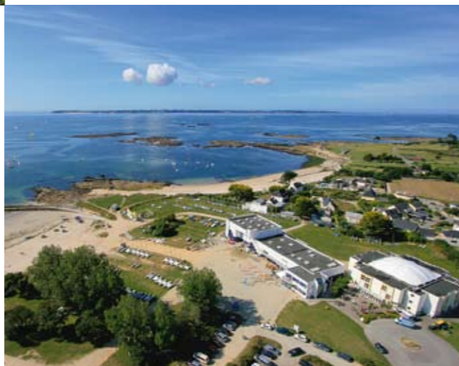
La Résidence loisirs de Kerguelen, en bordure du Parc Océanique et d'une plage de sable fin.