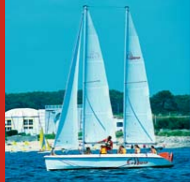
Le "Fillao" est une goélette de 9 m pouvant accueillir jusqu'à 14 passagers. À la fois confortable et performante, elle est idéale pour la découverte en mer et l'initiation en toute sécurité.