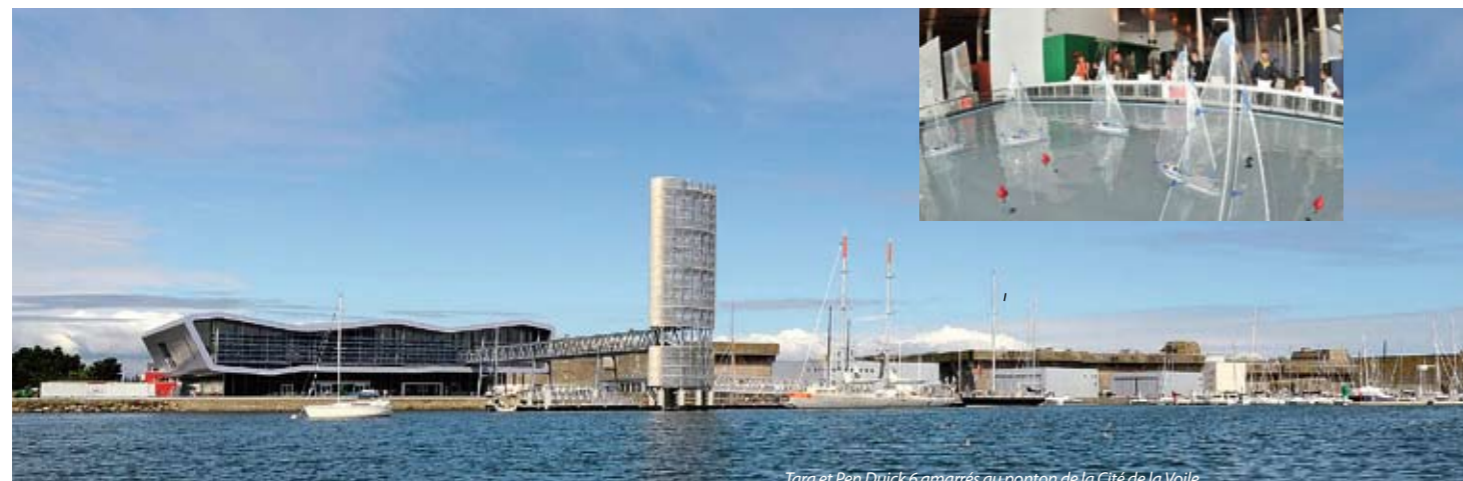
Tara et Pen Duick 6 amarrés au ponton de la Cité de la Voile

Lieu européen de découverte de la voile moderne la Cité de la Voile Éric Tabarly est le site pédagogique par excellence, à la croisée des compétences et des connaissances maritimes d'hier, d'aujourd'hui et de demain.